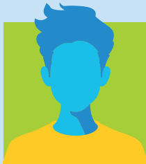
Aris Koktsidis Student